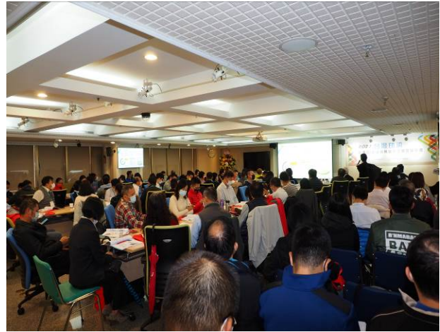
紡織業者出席踴躍