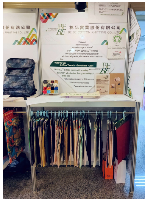
聯展廠商展位-棉品實業