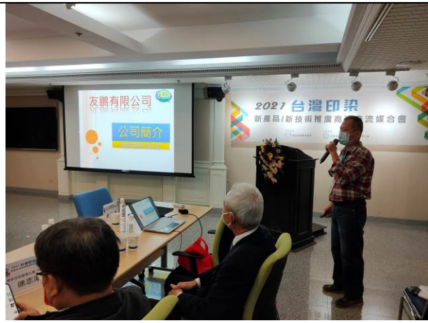
廠商聯合發表-友鵬林繼論 業務經理