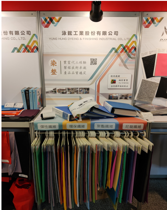
聯展廠商展位-泳鉞工業 環保紡織品