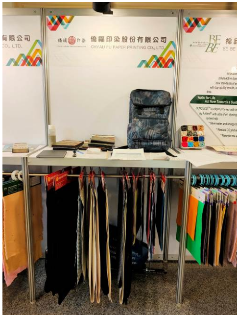
聯展廠商展位-僑福印染