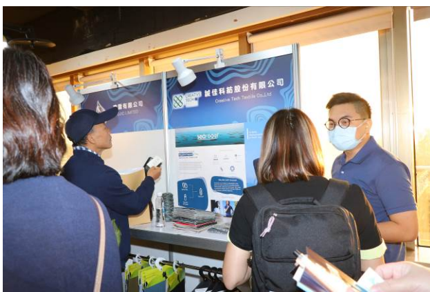
現場商洽交流情形