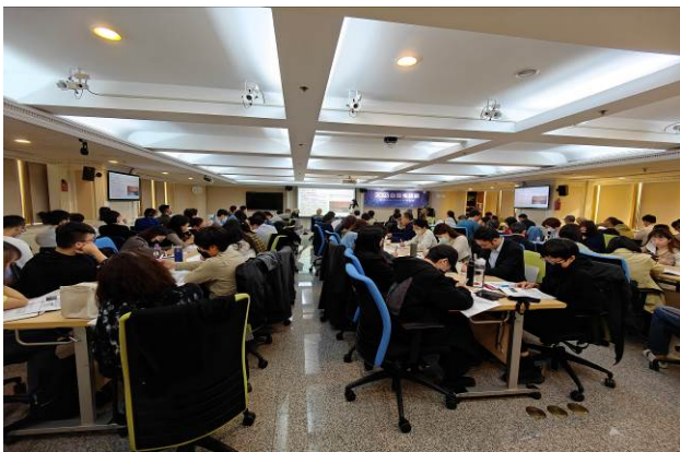
專題演講活動吸引超過 90 位同業出席參加