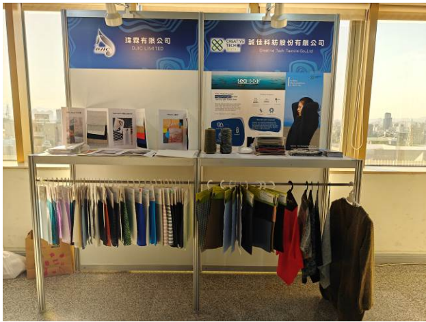
廠商展示攤位-瑋霖、誠佳科紡