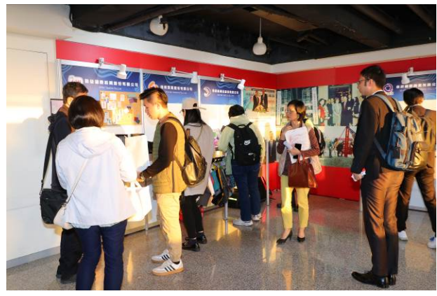
現場商洽交流情形