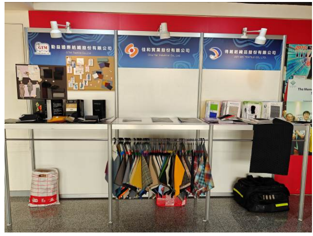
廠商展示攤位-勤益、佳和、得維