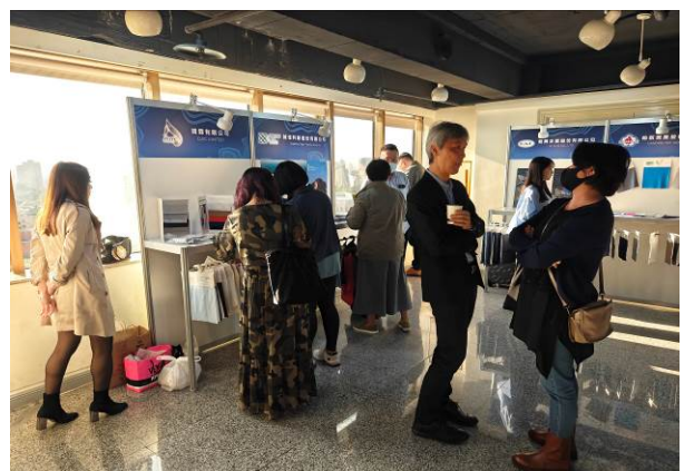
現場商洽交流情形