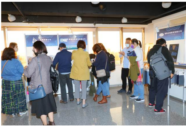
現場商洽交流情形