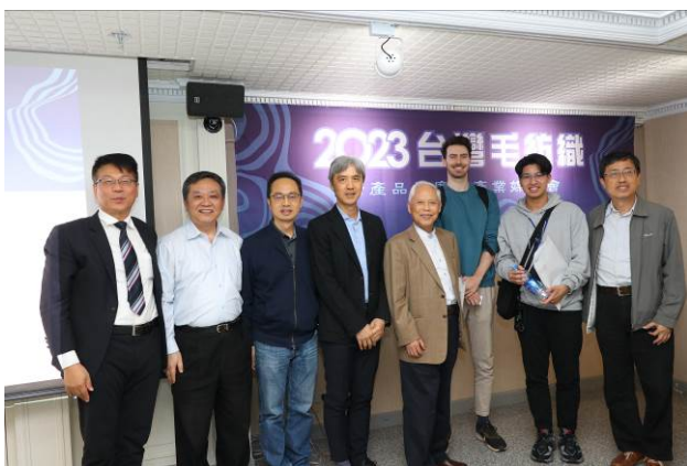
簡理事長與活動主持人、國外買主、公會廠商合影