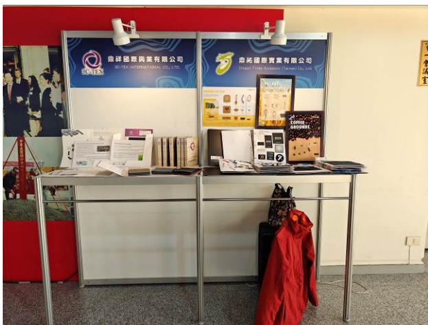
廠商展示攤位-鼎祥、鼎祐