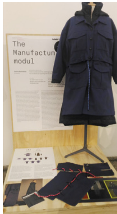
服裝作品圖組之三

共享原則。但是以車子來說，這樣的觀念較適用在中產階級房車上，豪華的車系，依然著重在買斷擁有。衣服，或者說時尚的有趣之處，或許就在於它從來不只是衣服物質而已。過去從無到有，開發新資源來生產，從搖籃走向墳墓的直線生命，可以各自分工，各管各的，最後扔掉、燒掉就好；但是從直線繞成循環時，資源的無限循環、生生不息，需要的就是共同分享的責任。以臺灣在紡織循環中最主要的布料製造商角色為例，根據英國資源循環組織WRAP（The Waste and Resources Action Programme）發表的織品循環圖來看，製造與設計是被放在一起的，這當中包括在設計時，永續布料製造上就聰明地透過與設計師合作，向消費者說明組成成分、使用後的收集、回收等知識。如同永續觀念試圖解決全球化所帶來的環境問題一樣，回歸到對大自然友善的循環做法，是需要共同分享知識與資源合作的，願所有關心並且欲加入永續循環行列的朋友，朝重設並確認積極與共享的價值觀努力，與全球同步。■