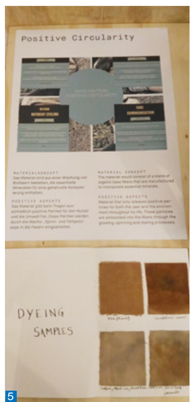
1.討論會現場。 2.探討及實驗多種可能性。 3.現場永續概念的作品展示Case Study。 4.active wear + 看板 5.解釋何謂循環當中的積極性。

同前本書中提到：「簡單樸素被高度商品化之後形成了生活風格的意識形態，人與人之間繼續運用金錢價值的變形來隔絕他人，標誌獨特；這當然不是大自然的想法，更不是樸實生活的本質...但是高高在上的『簡單』充滿商業的意味深長，已失去了簡單原創感人力量！但這種以簡單外標推銷複雜觀念的生活事實卻到處可見」。由於讀過這樣的提醒，筆者帶著批判的眼光檢視著active wear +中展示的作品，發現原來嚴格遵照循環價值觀所產生的設計，用意正是在克服上述這種被過度商業化，表面敷衍的意識形態。展覽中強調循環的積極性，若是資源被正確使用，應該是進入一種生生不息的循環中，這當中，從資源的研發、設計、使用、回收到再利用，都需要帶著積極的價值觀進行創新。呼應書中所述：「我們活在一個價值觀備受挑戰的時代，要如何化繁為簡，是需要重新調整自己對於生活的認識」。