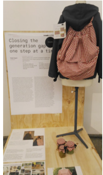
服裝作品圖組之二

工業革命時代及以前的創新，指的是從無到有的發明；而如今，符合循環價值觀的創新，筆者引述蔡康永先生曾經針對被過度使用的「創新」一詞，發表過切合循環經濟核心，升級回收（Upcycling）的看法：「不要認為你的創意是前所未有的，如果你認為你的創意是前所未有的，那只是你書讀得的不夠多而已，不是你真的那麼厲害，所以不要太把創新這件事情當成是極度的追求，我覺得創新被高估了，我覺得在日常生活中，不斷的用有創意的手法處理舊的東西，是比一味地追求創新，更實際、也更雋永的事情」。