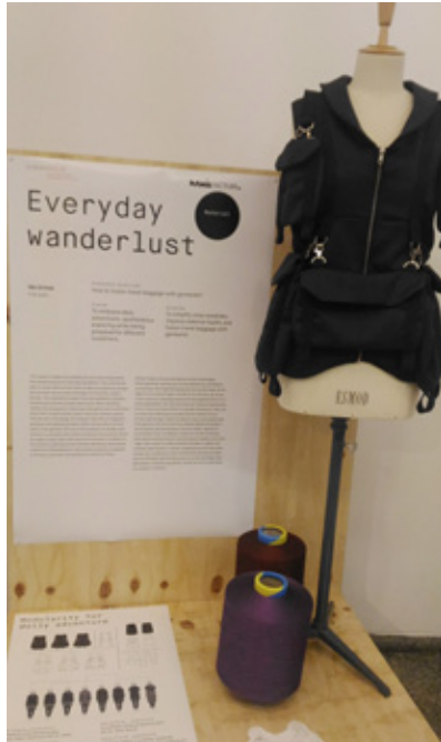
服裝作品圖組之一

因此，對承受如此差異及壓力的亞洲製造商來說，與歐洲鼓吹織品循環觀念的品牌合作，當然非常重要，因為願意參與加入循環系統的全球每一分子，普遍代表了願意去瞭解及重視亞洲製造商面對的這類不平情況。循環，是積極的作為。