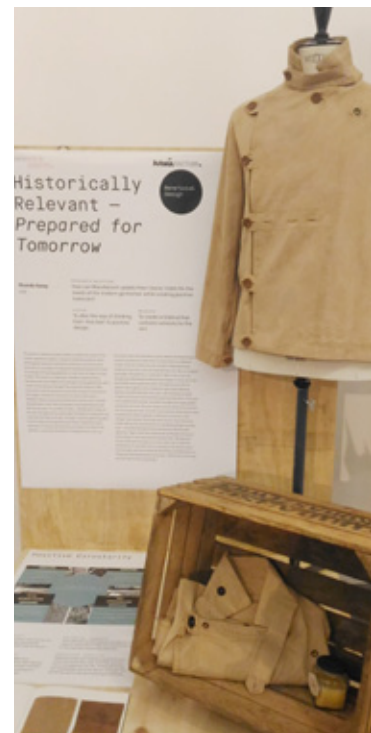
服裝作品圖組之四